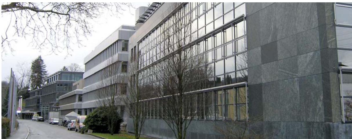
Mattenstrasse 8, Gümligen